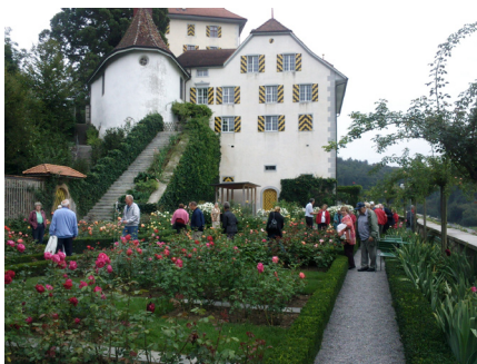
Schloss Heidegg mit Rosengarten

Der Himmel war wolkenverhangen, als sich am 7. September 43 Seniorinnen und Senioren zur halbtägigen Herbstreise 60+ einfanden. Vergnügt fuhren wir auf interessanten Umwegen zum Schloss Heidegg in Gelfingen oberhalb des Baldeggersees. Dort teilte sich die Gruppe auf. Die einen wurden unter kundiger Leitung durch das Schloss geführt, die anderen liessen sich in dem in voller Blüte stehenden und duftenden Rosengarten allerlei erklären oder zogen auf eigene Faust los.