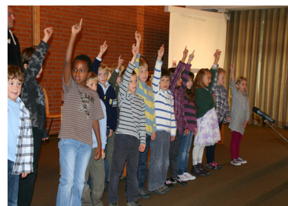
Drittklässler beim Singen