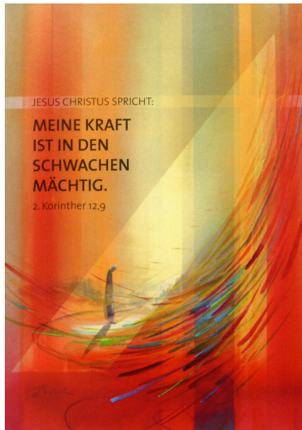
Jahreslosung 2012: 2. Korinther 12,9